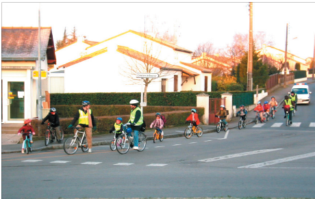
Près de la Poste à Beautour...

Les prochains velobus sont organisés au rythme d'un samedi par mois : les 18 mars, 15 avril, 13 mai et 10 juin.